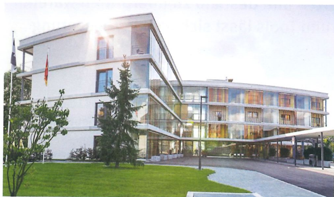
Betreutes Wohnen im modernen Alenia-Neubau an der Nussbaumallee 2 in Gümligen.

Dies bestimmt und beeinflusst die Art und den Umfang der nachgefragten Dienstleistungen. Alenia ist der Auffassung, dass ein Grund-Dienstleistungsangebot möglichst pauschal angeboten werden soll. Damit können Diskussionen wie «...kaum brauche ich etwas, kriege ich umgehend eine Rechnung» vermieden werden. Dennoch bewähren sich bei Alenia wählbare Dienstleistungspakete, standard und flexibel . Während im Dienstleistungspaket standard die üblichen Dienstleistungen inbegriffen sind, bestehen diese bei flexibel in reduziertem Mass. Weitere Leistungen können gegen Rechnung individuell ergänzt werden.